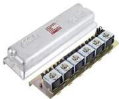
A- Caja de Válvulas

ASCO ofrece una línea completa para para la automatización de colectores de polvo.