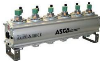
B-Tanques de Aluminio